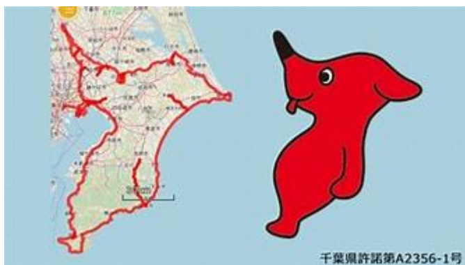
チーバ君

千葉県のマスコットキャラクターであるチーバ君の鼻の部分が野田市になり利根川と江戸川の分流点に位置しています。何故このような地形になったのか博物館には利根川、江戸川そして伊奈忠次が行った利根川東遷事業の歴史が展示されています。前回まで実施した赤山街道の締めくくりになります。