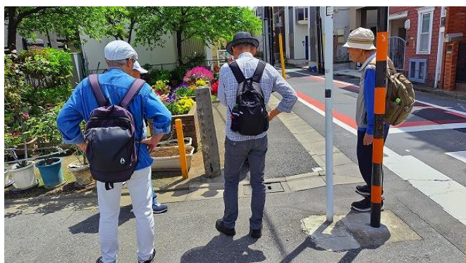
日光街道千住追分：水戸佐倉道分岐