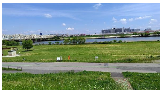
荒川：正面は小菅刑務所