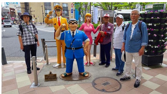
こち亀（両さん、中川、麗子）像