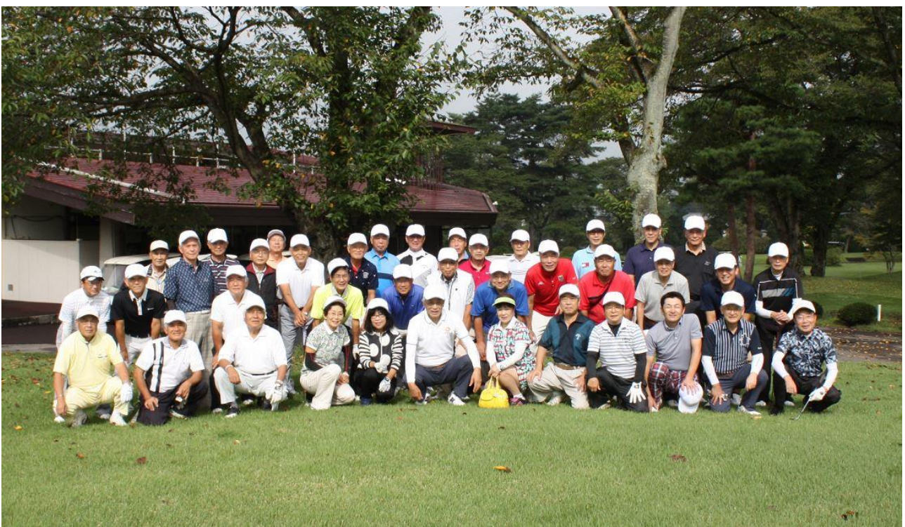
(スタート前の集合写真)

今後も、このような支部をまたぐ交流が続けられたらいいなと思いながら帰途につきました。