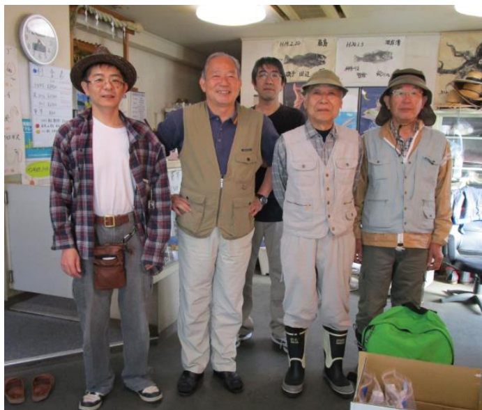
出船前に隠居屋にて