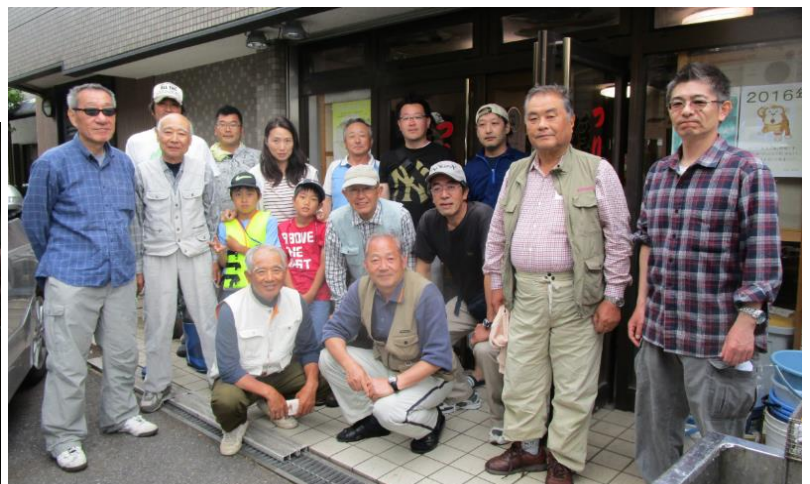
船宿・隠居屋にて記念撮影