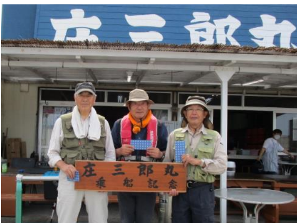
船宿「庄三郎丸」にて記念撮影