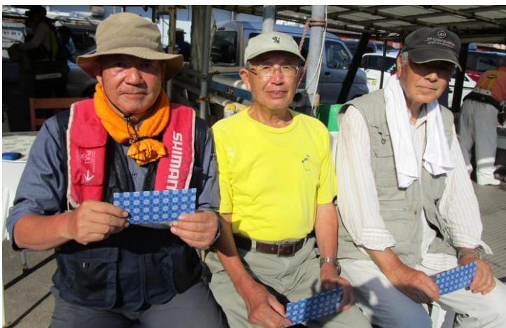
船宿「山下丸」にて記念撮影