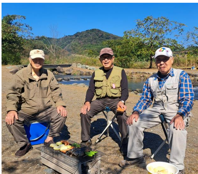
河原にて「バーベキュー」