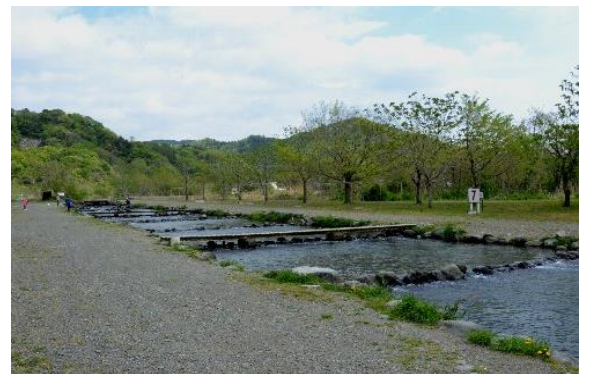
マス釣り場の中央付近から上流側