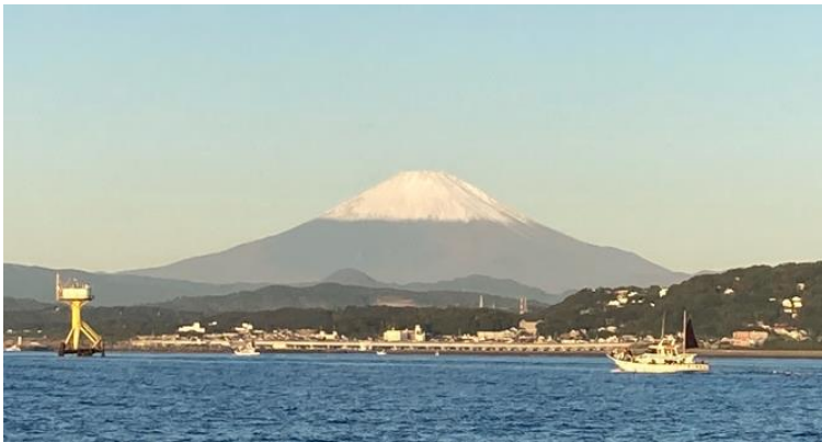
大磯沖からの富士山