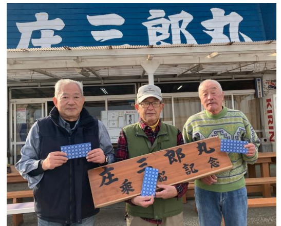
船宿「庄三郎丸」にて記念撮影