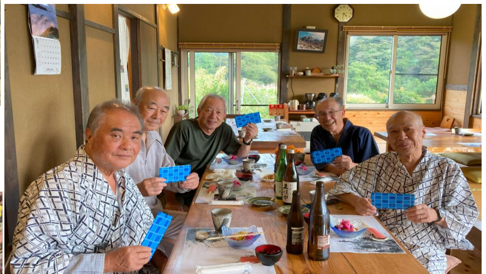
民宿「五郎舎」の食堂にて表彰式