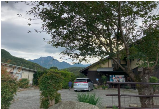
瑞牆山 (2,230m) と「五郎舎」