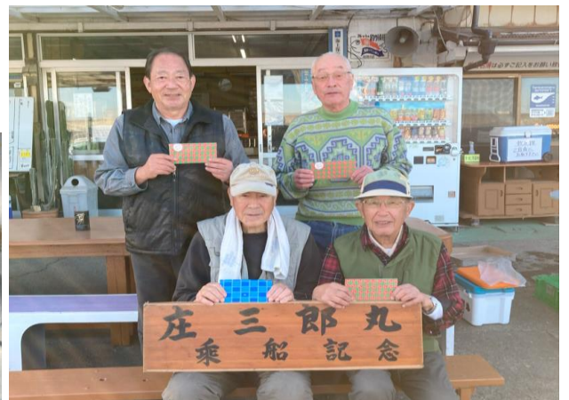
船宿「庄三郎丸」にて記念撮影