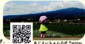
あじさいちゃん公式Twitter

開成町の3か所の店舗・施設に行き、スマートフォンで2次元バーコードを読み込みと3Dのあじさいちゃんが登場！一緒に撮影ができます。あじさいちゃんの出現ポイントは、あじさいちゃんの公式Twitterでお知らせします。