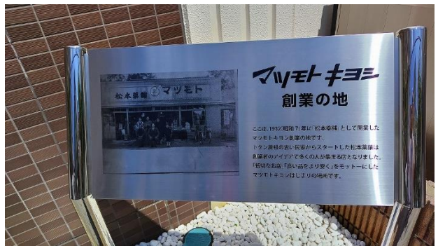
マツモトキヨシ創業の地