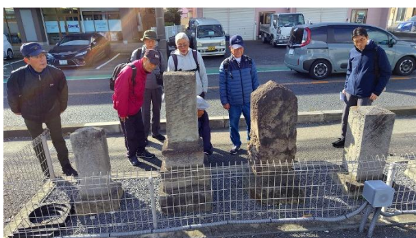
庚申塔（野田市山崎）