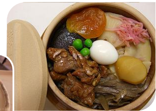
昼食はドライブインで