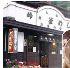
釜めしもソバも 美味しい