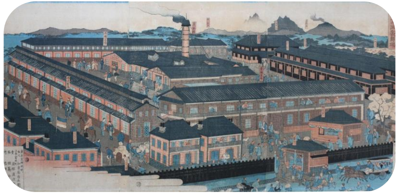
富岡製糸場は明治5年(1872)誕生、平成26年世界遺産に登録