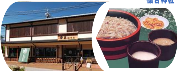
昼食は信州の「はいかが」