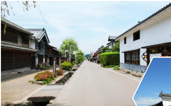
日本の道百選・ウダツもあるヨ