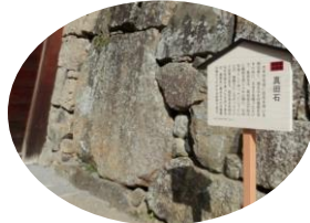
上田城は大河ドラマ「真田丸」で満杯