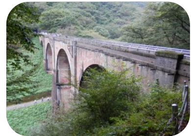
めがね橋：200万8000個のしがで造ら れている