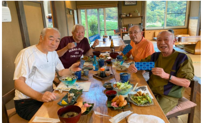
民宿「五郎舎」の食堂にて表彰式