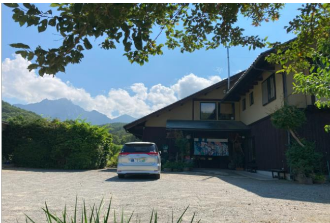
瑞牆山 (2,230m) と民宿「五郎舎」