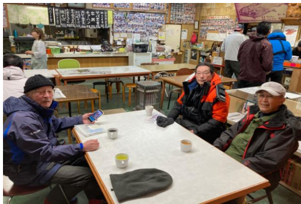
出船前の釣り談義