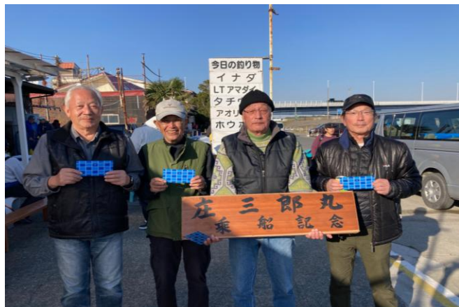
船宿「庄三郎丸」にて記念撮影